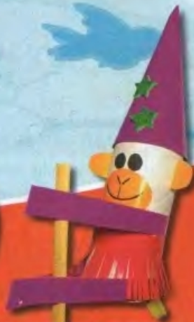
ОБЕЗЬЯНКА символ 2016 года