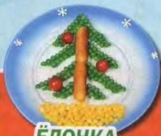
ЁЛОЧКА забавная кулинария