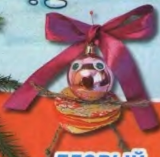
ЕЛОВЫЙ ЧЕЛОВЕЧЕК ручная сборка