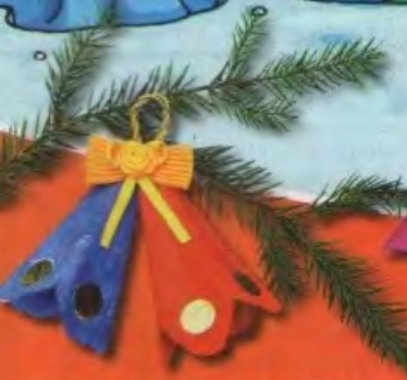
КОЛОКОЛЬЧИКИ подвеска на ёлку